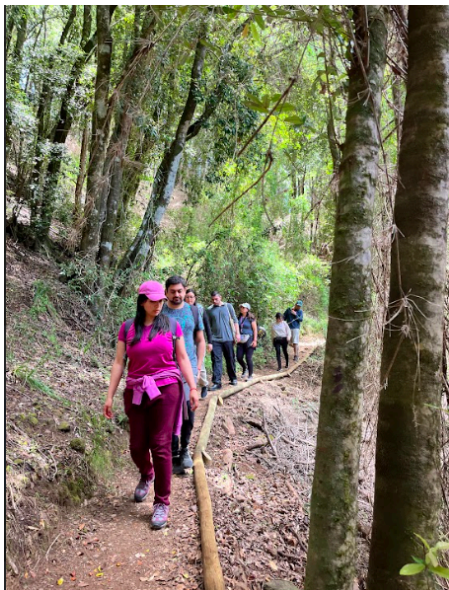
Fotografía Nº4: Caminata silenciosa por el sendero Parque Nacional Nonguén.