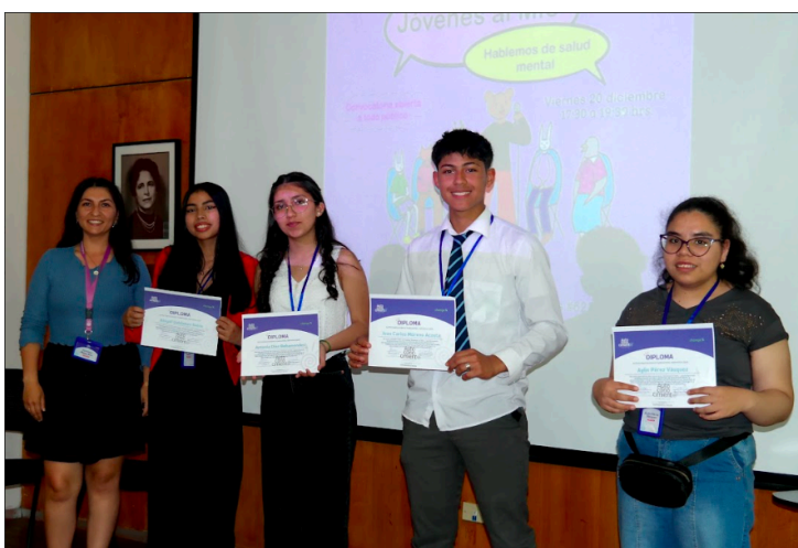
Fotografía N°8: Reconocimiento a jóvenes ganadores del concurso “Jóvenes al Mic” quienes además expusieron sus temáticas relacionadas a la salud mental.