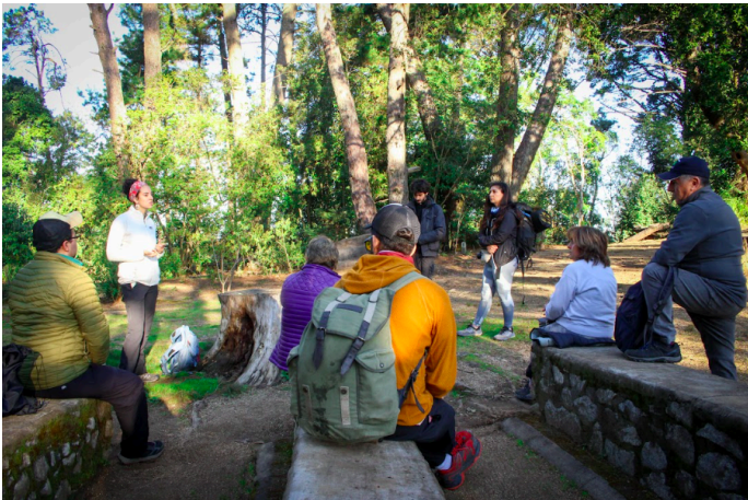
Fotografía Nº2: Actividad: elegir un elemento de la naturaleza que encontremos en el bosque que nos represente y compartirlo con el grupo.