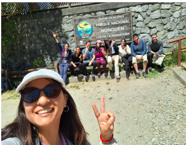
Fotografía Nº6: Cierre de la actividad y despedida de los/las participantes.