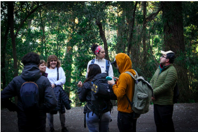
Fotografía Nº3: Cierre grupal de la actividad con meditación y retroalimentación.