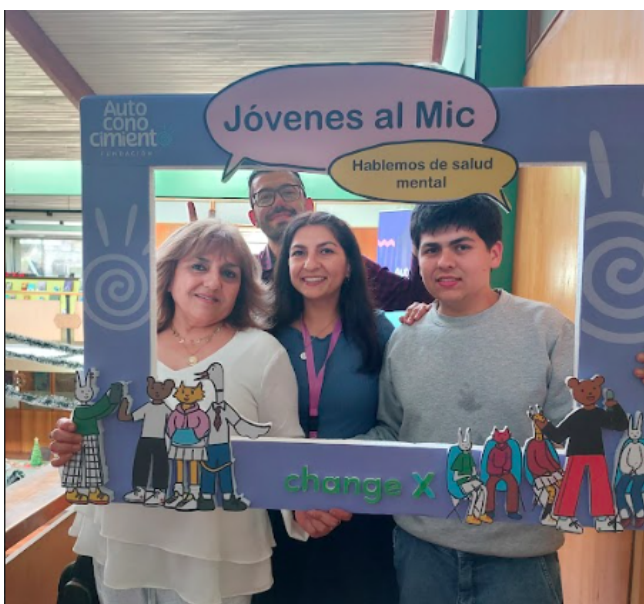
Fotografía N°9: Fotografías en el coffee break con participantes de la Conferencia.