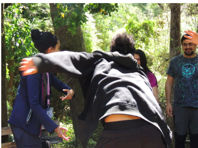
Fotografía Nº5: Actividad: Movimiento corporal representando los movimientos de bosque